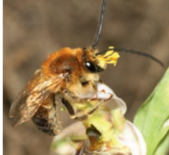
Männchen mit Pollinien