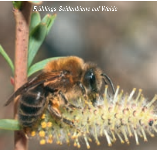
Frühlings-Seidenbiene auf Weide