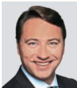
Landeshauptmann-Stellvertreter Dr. Manfred Haimbuchner