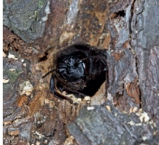
Holzbiene schlüpft aus dem Nest