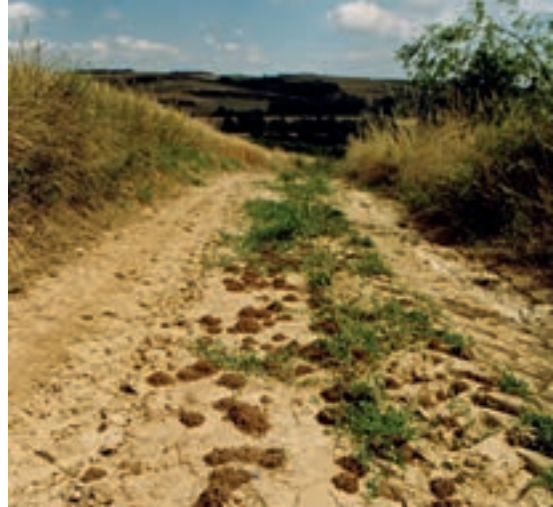
Unbefestigter Hohlweg als Nistplatz