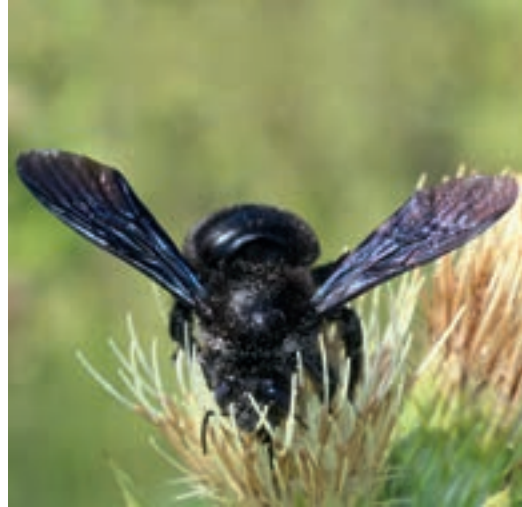
Blauschwarze Holzbiene auf Blüte

Obwohl absterbende Bäume einen natürlichen Prozess darstellen, wird Totholz leider oft als Mangel an Pflege betrachtet. Dabei sind neben einer Vielzahl an Insekten auch hohlraumbrütende Vögel auf das morsche Zuhause angewiesen.