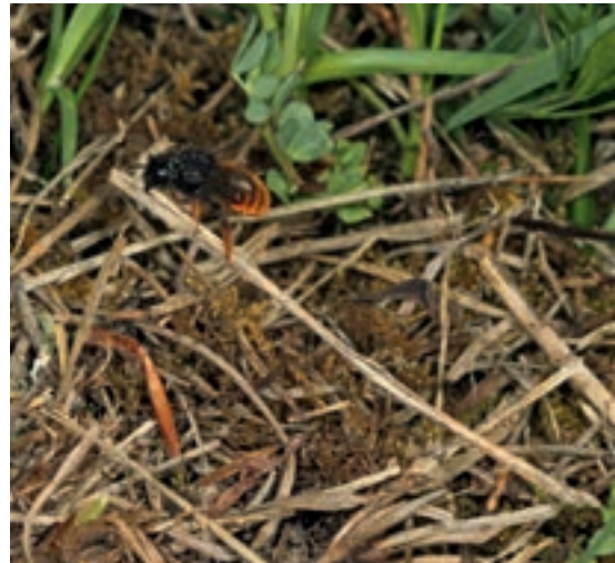
Schneckenhausbiene mit Grashalm