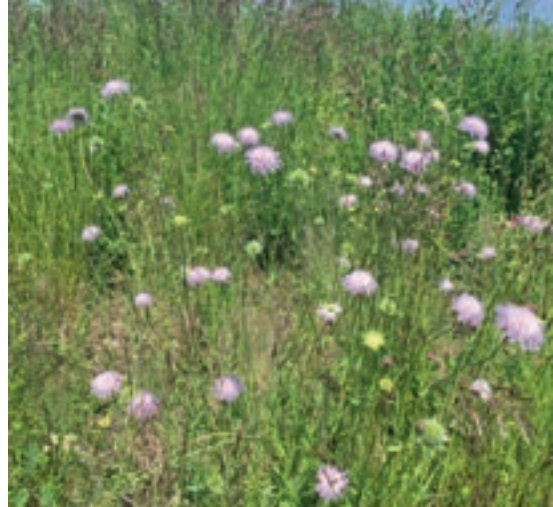
Magerwiese mit Acker-Witwenblumen