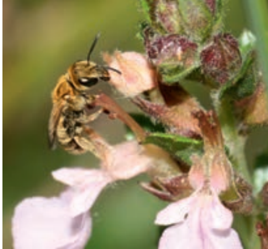
Gold-Furchenbiene beim Blütenbesuch