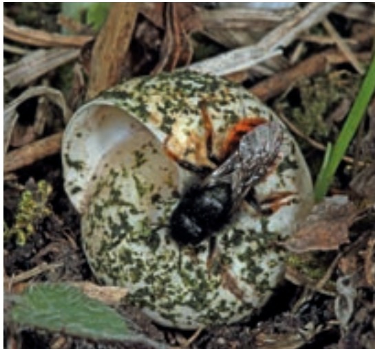
Schneckenhaus mit Pflanzenmörtel