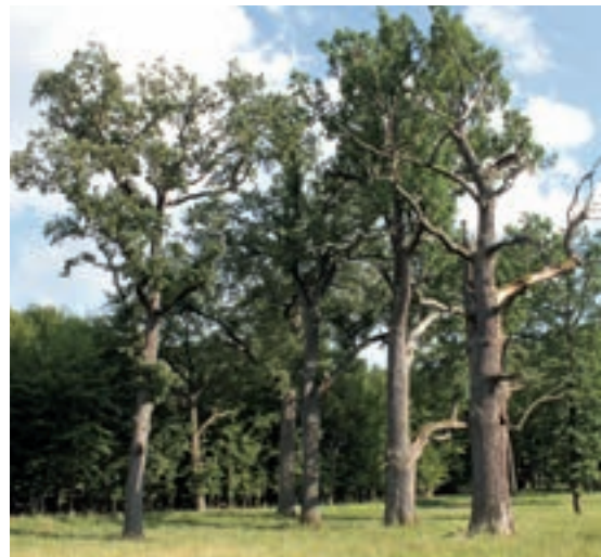
Bäume mit morschen Ästen