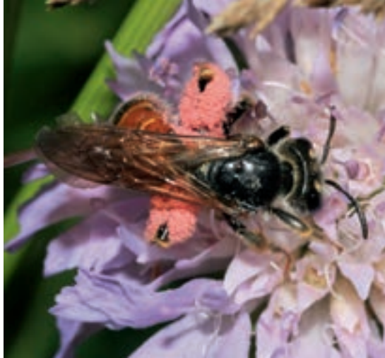
Knautien-Sandbiene mit rosa Pollen