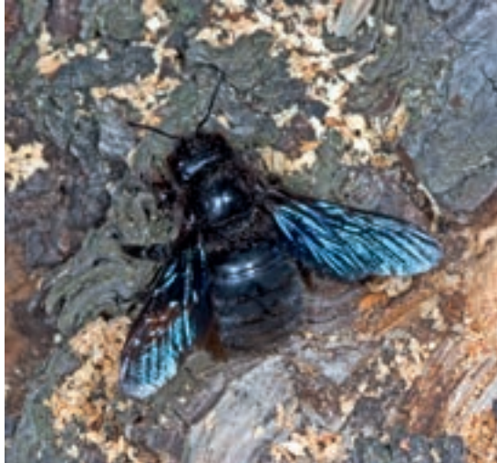
Holzbiene beim Nestbau